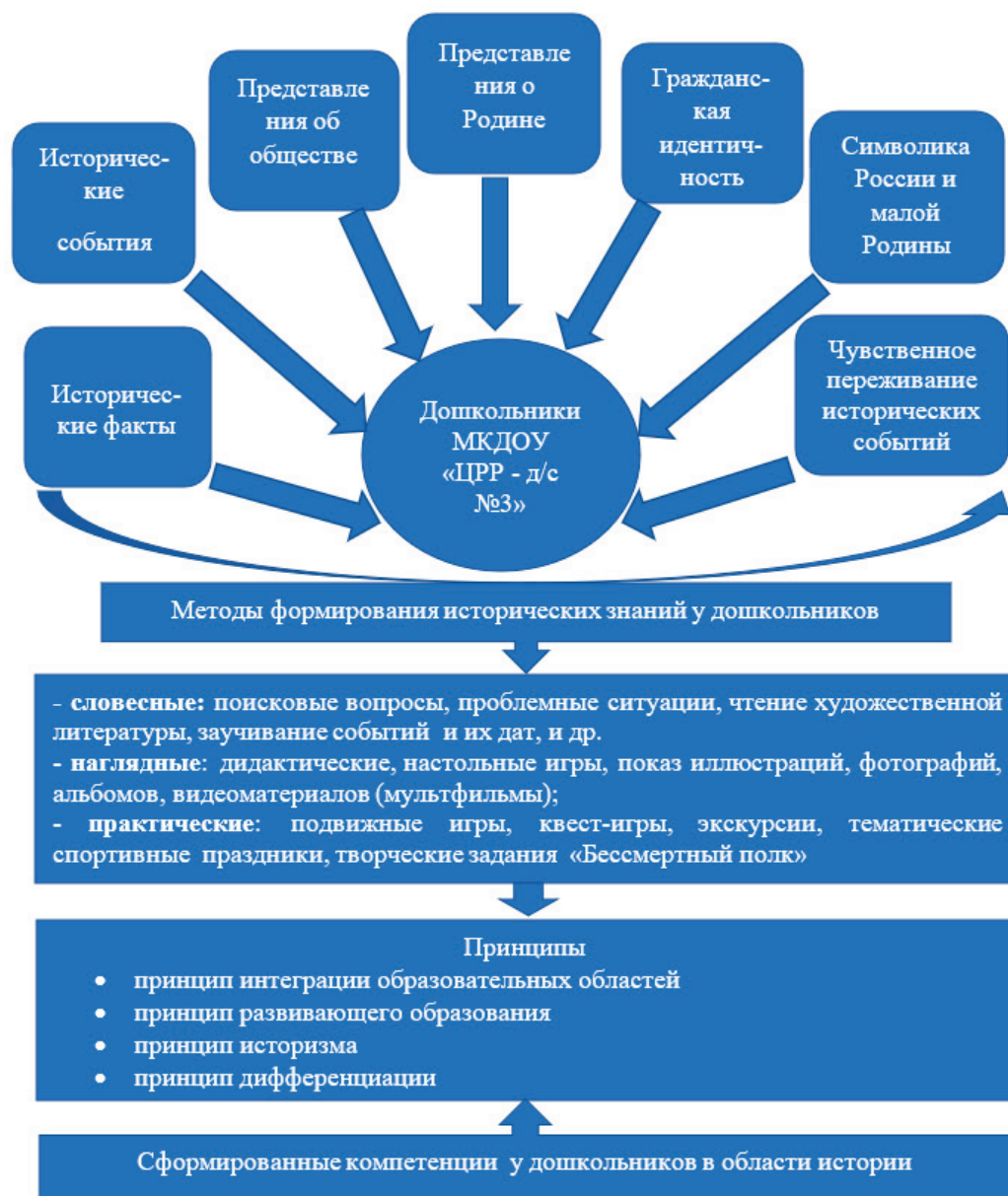
Рис. 1. Модель формирования исторических знаний у дошкольников

Учитывая факт того, что исторические знания представляют собой вид общественного сознания, выделяется в зависимости от возраста субъекта, имеют все те атрибутивные характеристики, которые отличают общественное сознание в целом. В связи с этим разработанная модель имеет следующие структурные компоненты.