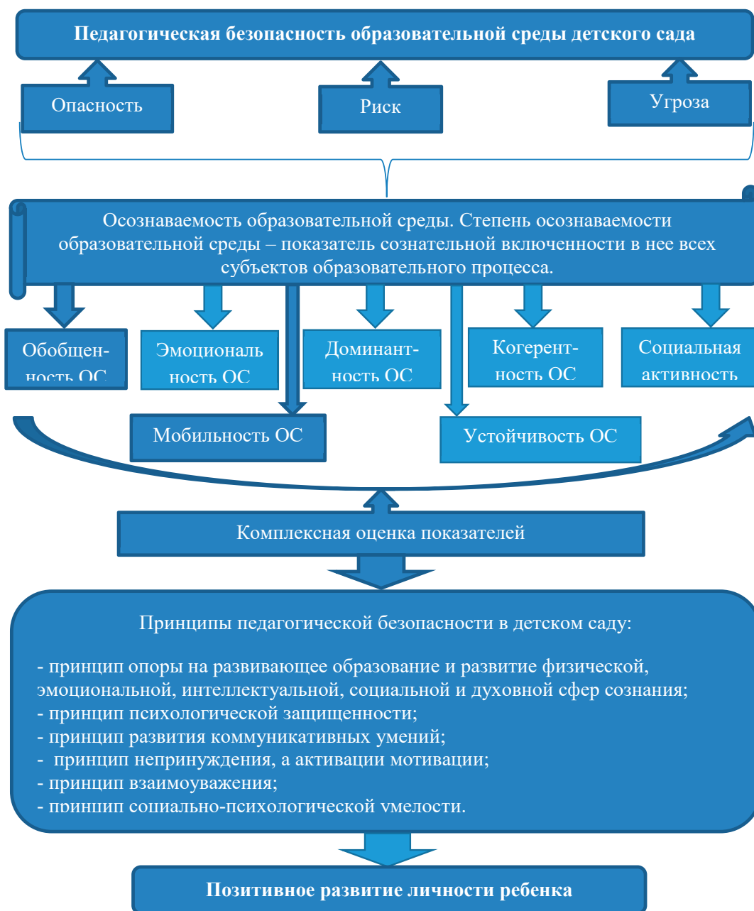
Рис. 1. Модель педагогической безопасности образовательной среды детского сада

Результаты и их обсуждение. Под педагогической безопасностью понимается среда взаимодействия, свободная от проявления любого насилия, имеющая образовательную значимость для субъектов образовательного процесса и характеризующаяся преобладанием гуманистической центрации на интересах заказчика образовательных услуг и отражающаяся в эмоционально-личностных характеристиках ее субъектов. Безопасность педагогической среды предполагает формирование здоровой личности, поддерживает и развивает её психическое здоровье и хранит психологическое благополучие.