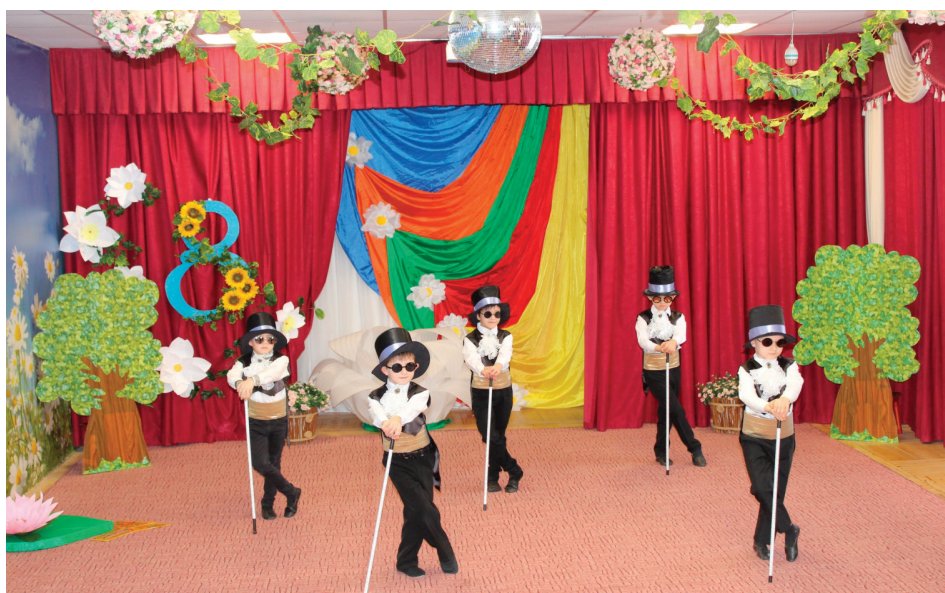
Рис. 4. Танец Кротов