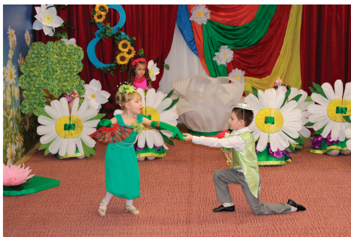
Рис. 2. Мадам Жабэ и мистер Кваки

Мы петь будем песни с тобой до утра! Ква-ква-ква-ква!!!