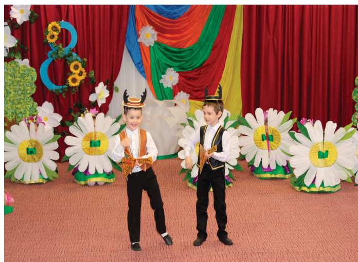
Рис. 3. Жуки на цветочной полянке

Я джжжентельмен, сударыня, и вас зову на бал!