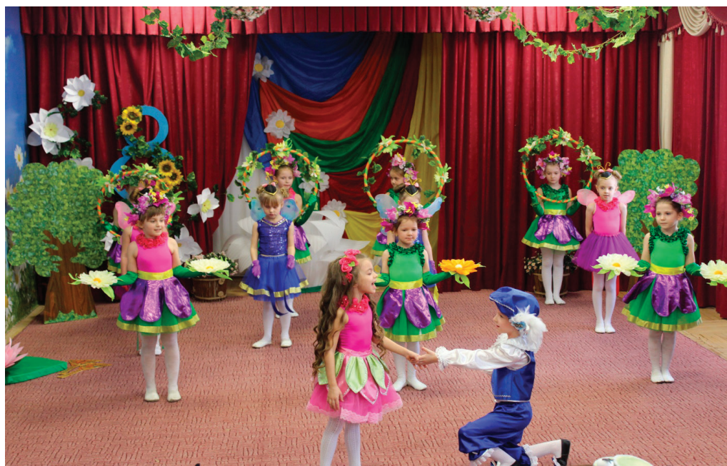
Рис. 5. Встреча Дюймовочки и принца