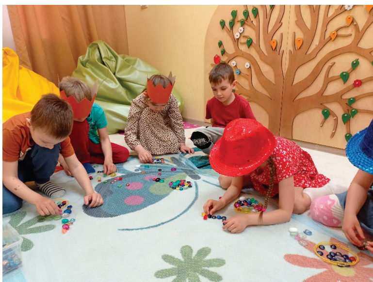
Рис. 1. Создание мандалы детьми дошкольного возраста

Проиллюстрируем создание волшебного круга-мандалы детьми на рис. 1.