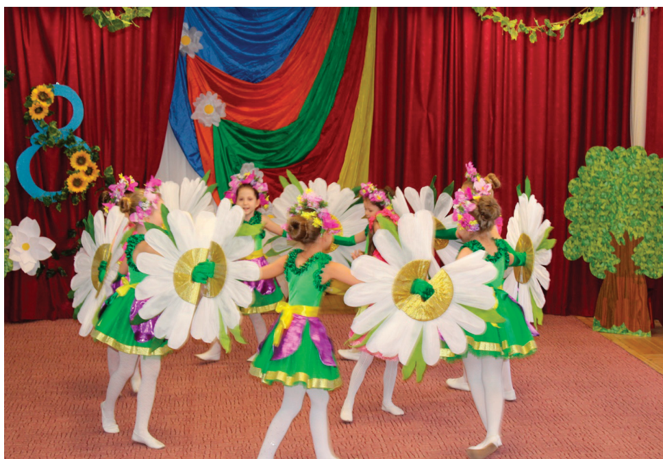
Рис. 1 Танец цветов и Дюймовочки

(Дюймовочка поёт песню «Из золотых тучек», автор текста — Ю. Энтин, музыка — Е. Крылатов)