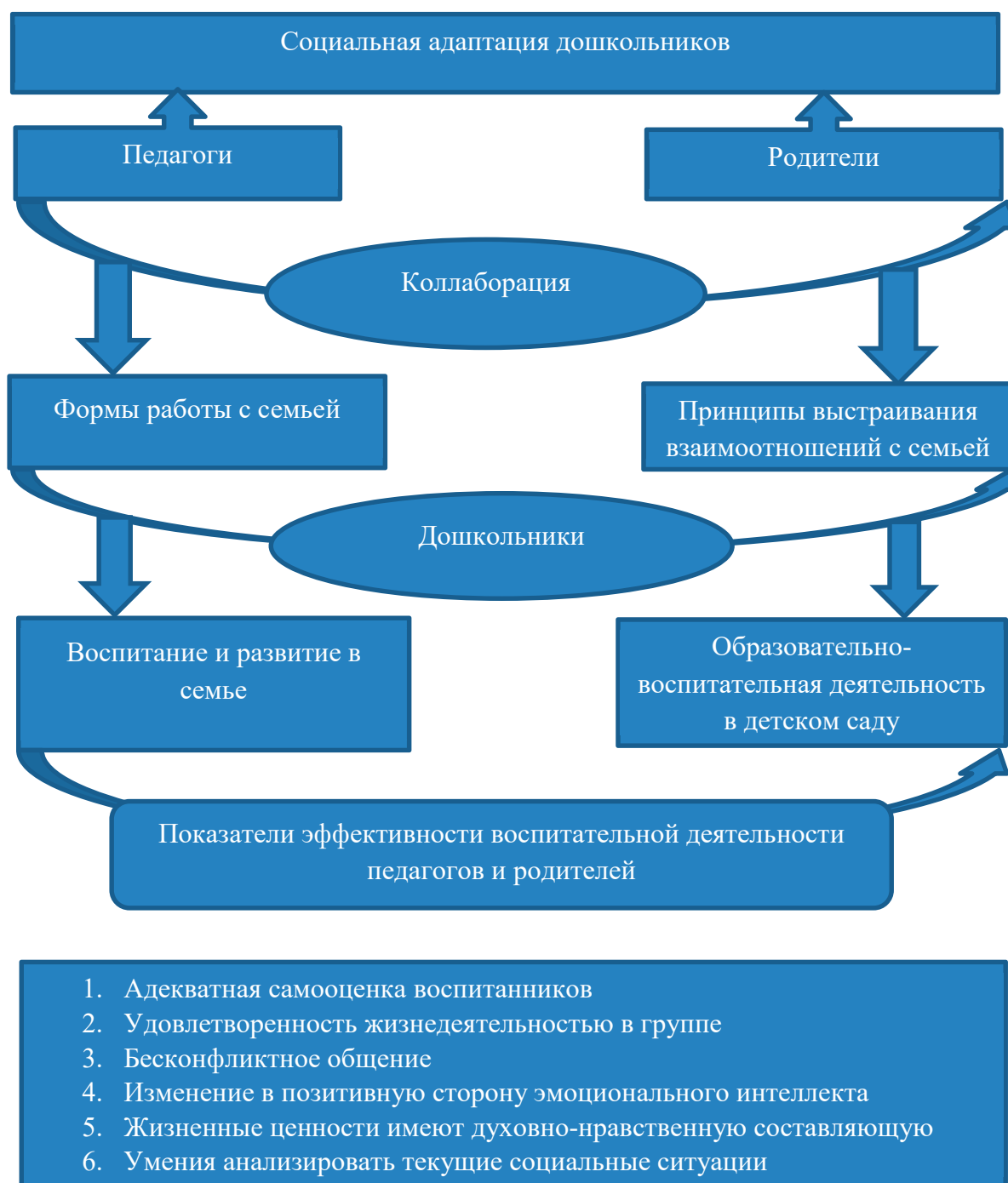
Рис. 1. Модель взаимодействия педагогов и родителей для успешной социальной адаптации дошкольников

Совместные мероприятия педагогов и родителей: родительские совещания; вечера для родителей; тематические выставки; попечительский совет; школа для родителей; родительский комитет и др.