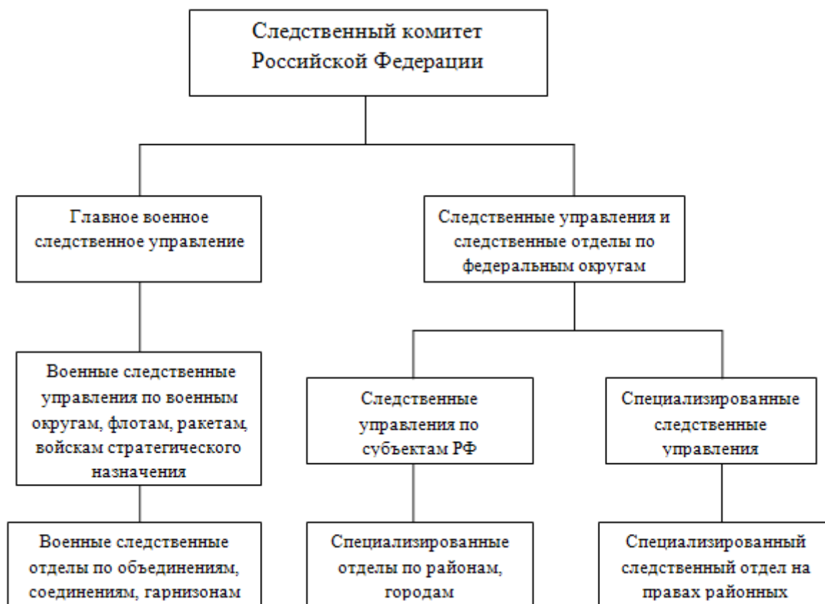
Рис. 1. Структура Следственного комитета

О важности налаживания правового механизма уголовного преследования и организации органов его осуществляющих в условиях состязательности и разделения властей Н.В. Муравьев высказался так: «Разделение уголовно-судебных функций (на судебную, защитную и об-