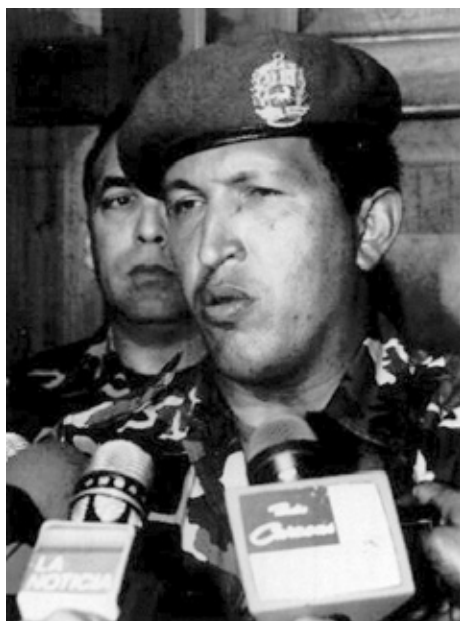
Рис. 3. Уго Чавес после провала мятежа 4 февраля 1992 г.

ически ореол страдающего честного борца с режимом, было в высшей степени неразумно. В этих условиях для Кальдера самым верным было бы убрать Чавеса из Вене-