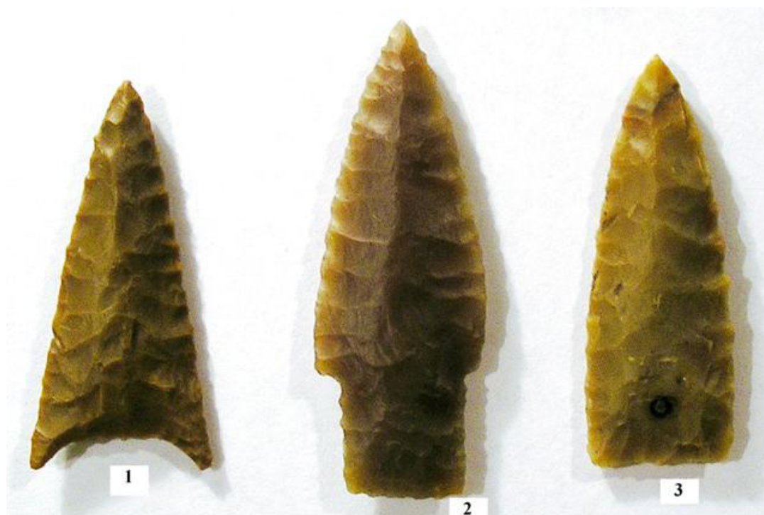
Рис. 1. Юринский (Усть-Ветлужский) могильник. Кремневые наконечники стрел. Подъемный материал 2002 г.

Обработанные сплошной двухсторонней уплощающей ретушью, наконечники стрел Юринского могильника подразделяются на четыре типа: 1) наконечники треугольной или подтреугольной формы с прямоусеченным основанием — 22 экз. (рис. 1, 3); 2) наконечники треугольной формы с вогнутым основанием — 2 экз. (рис. 1, 1); 3) наконечники с вытянуто-треугольным пером и широким черешком подпрямоугольной формы — 2 экз. (рис. 1, 2); 4) наконечник треугольно-черешковой формы с жальцами — 1 экз. Большинство наконечников изготовлено на отщепках