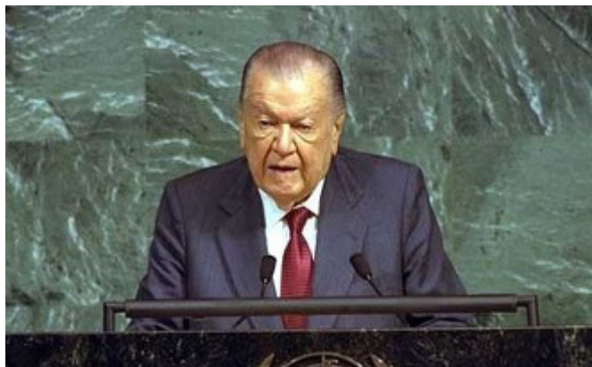
Рис. 1. Рафаэль Кальдера в годы своего второго...

Нужно сказать, что кризисы были в истории Венесуэлы и раньше: Федеральная война в середине XIX века, диктатура Гомеса в начале и Переса Хименеса в середине XX века. Но в этот раз кризис приобрел особенно опасную форму, поскольку политические проблемы соседствовали и были связаны с экономическими. В этой ситуации IV республику могло спасти только чудо. Чуда можно было бы ждать от молодого, сильного правителя — но его не было.