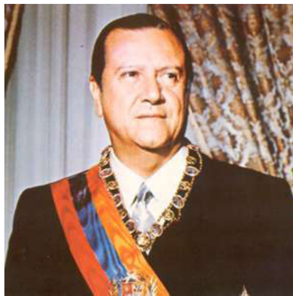
Рис. 2. ... и первого президентского сроков.

«Пакт Пунто-Фихо» получил свое название по месту подписания — крупнейшему на тот момент городу штата Фалькон Пунто-Фихо [3, с. 803], где тогда располагалась резиденция Рафаэля Кальдера [2, с. 116], в которой и был 31 октября 1958 г. подписан этот документ. Выработанный Кальдерой, имевшим профессиональное юридическое образование, при сотрудничестве с членами своей Социал-христианской партии, а также партии Демократическое действие, пакт был гарантом создаваемой