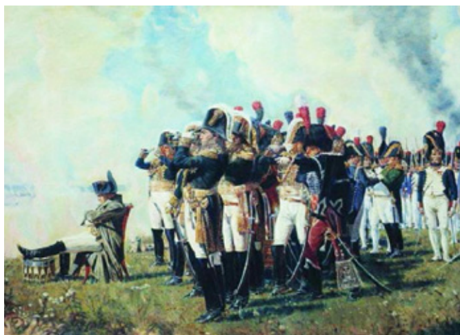
В. Верещагин. «Наполеон на Бородинских высотах»