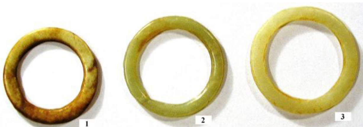
Рис. 2. Юринский (Усть-Ветлужский) могильник. Нефритовые кольца. Подъемный материал 2001 г.

коричневого, светло-серого, розовато-серого, бордового, молочно-белого и чёрного кремня. Длина самого крупного наконечника, поднятого в размытой части Юринского могильника осенью 2008 г., — 6 см.