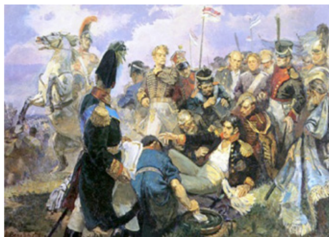
А. Вепхадзе. Смертельное ранение генерала Багратиона на Бородинском поле

Восьмая атака за 6 часов. Несмотря на сильную потерю, французы стремились овладеть флешами, которые буквально завалены трупами людей и лошадей. Пешие, конные и артиллеристы обеих сторон, вместе перемешавшись, бились с отчаянной храбростью. Лично возглавив атаку, князь Багратион к крайнему сожалению всей армии получил тяжкую рану и вынужден был оставить место сражения. Сей несчастный случай весьма расстроил удачное действие левого нашего крыла. В командование вступил генерал Коновницын. Видя, что резервов нет, он отвёл полки за Семёновский овраг. [3, с. 188]