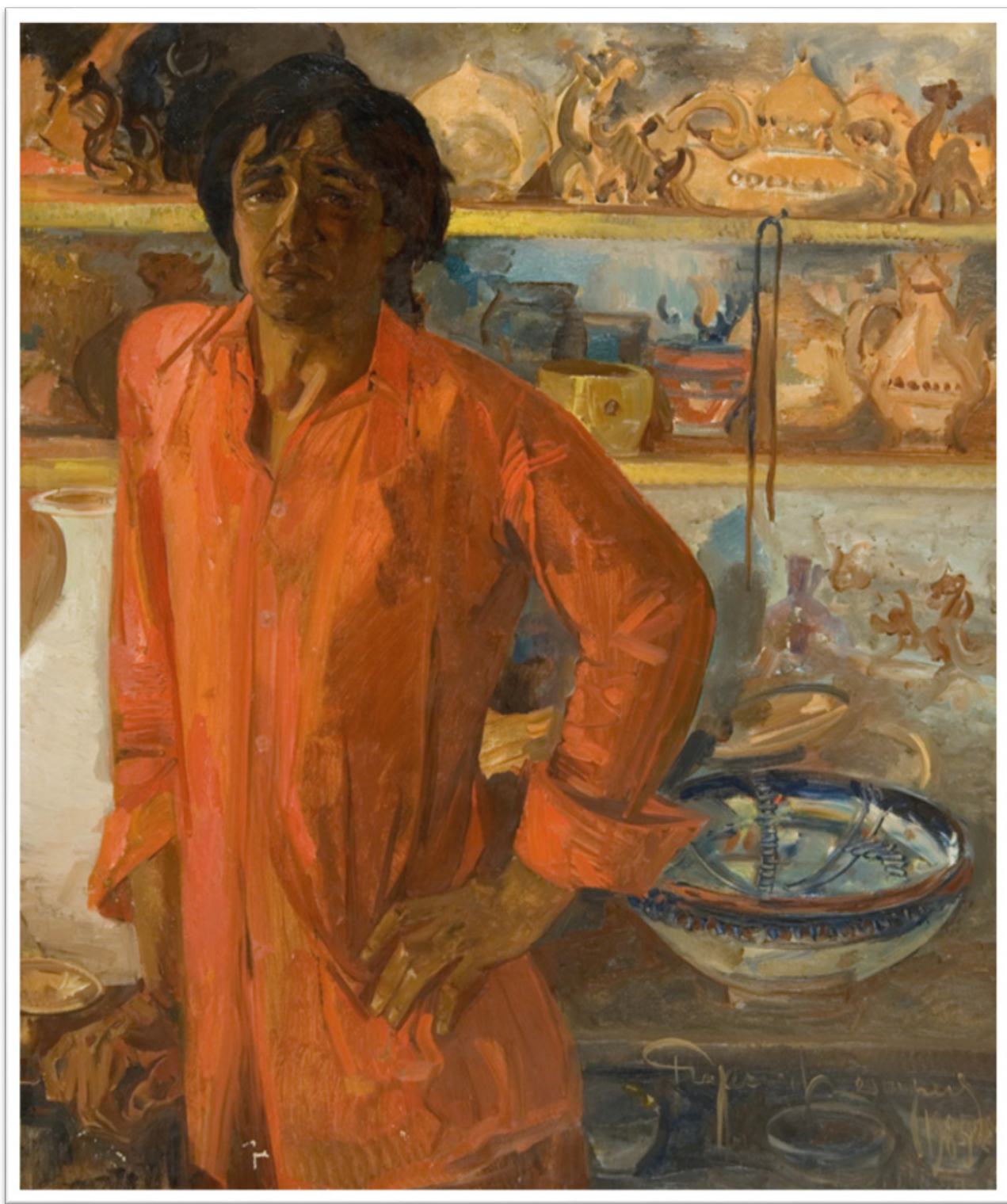
Рис. 1. «Портрет керамиста Хакбердыева»

Рузы Чариев поддерживал талантливую молодежь, некоторые его ученики жили у него дома. Чариеву присуждены почетные звания Заслуженный деятель искусств Республики Узбекистан, Народный художник Узбекистана; награжден орденом Эл-юрт Хурмати.