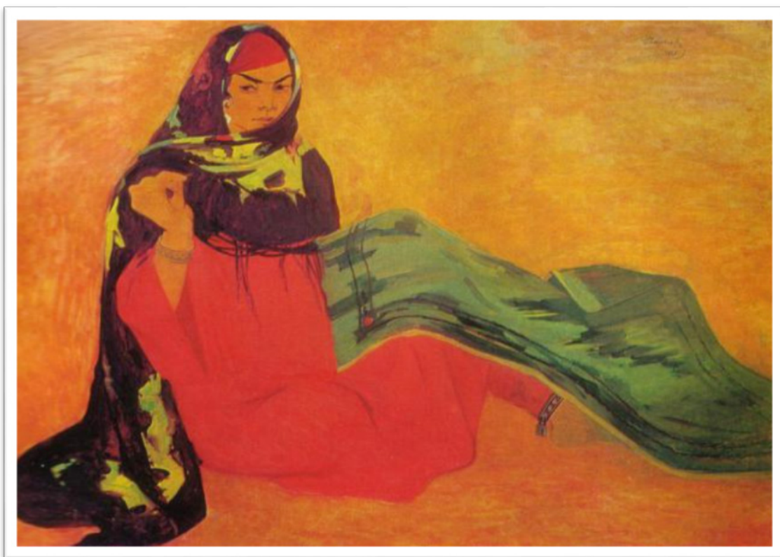
Рис. 2. «Невеста»

Писать о такой неординарной творческой личности и ярком человеке, как Рузи Чариев, — задача чрезвычайно трудная. Трудность заключается в том, что Чариев был человеком харизматическим, его экспрессивная манера жить была столь яркой, что в памяти творческой общности и сознании массы знавших художника людей нередко заслоняла собой его качества как живописца. Несмотря на то, что профессия художника не предполагает широкой известности, а художник по роду своей деятельности — персона более камерная, чем актеры или певцы, Рузи Чариев поистине был широко популярным и являлся неким символом национальной творческой богемы. Эта фантастическая популярность в народе порой мешала более внимательно отнестись к сути его уникального живописного мастерства. На самом деле картины Р. Чариева — это исключительно пронзительная мелодия в общем симфоническом звучании национального изобразительного искусства нашего времени.