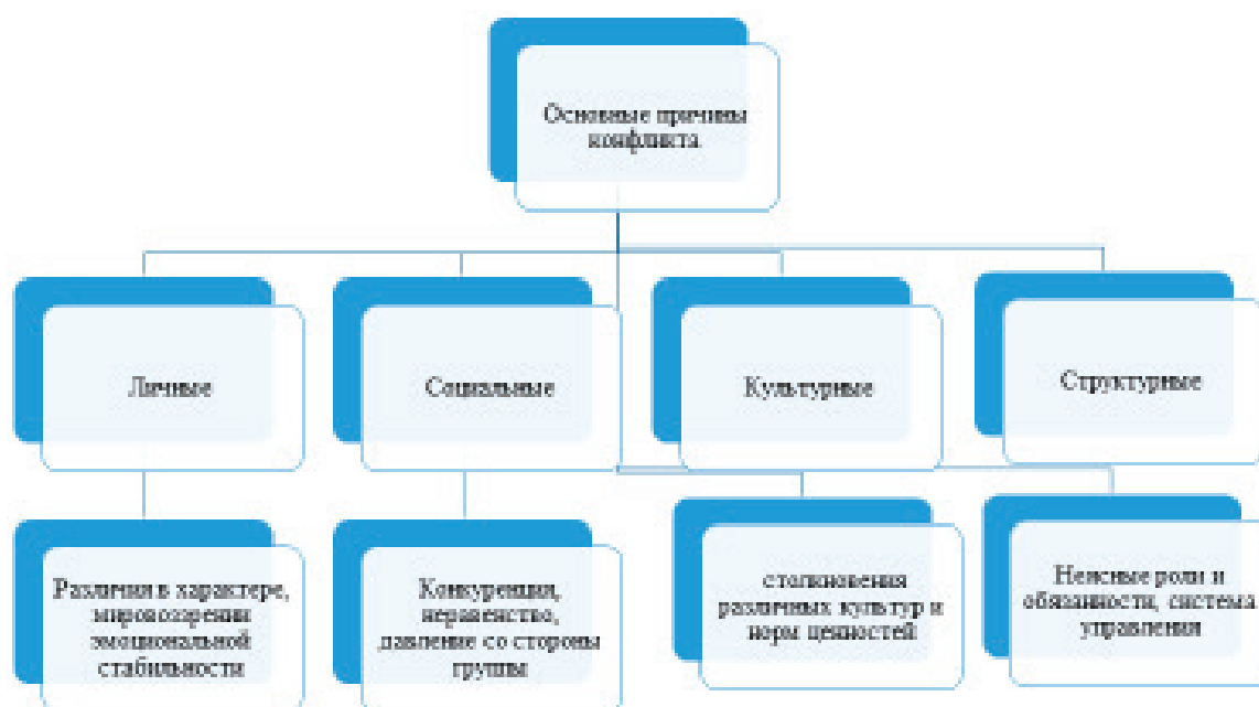
Рис. 1. Основные причины конфликтов