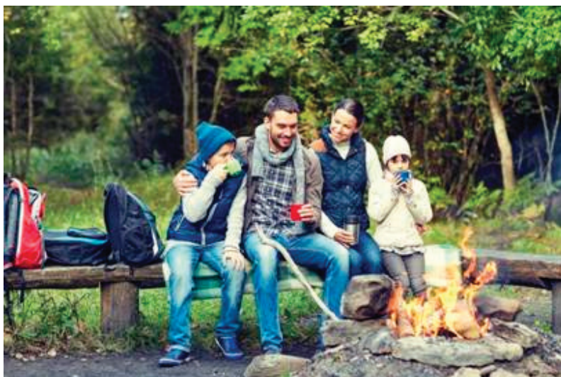
Рис. 1. Пример иллюстрации к заданию ОГЭ по обществознанию

Для иллюстрации какой социальной потребности человека может быть использована данная фотография? Объясните, почему эту потребность относят к социальным. Какие еще потребности относят к этому виду? (Назовите любые две потребности.) Какова роль потребностей в жизни?