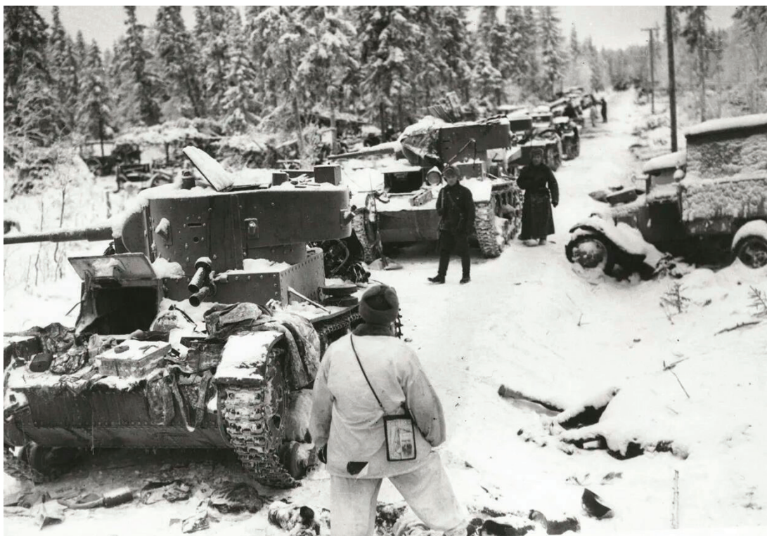
Рис. 1 [4]