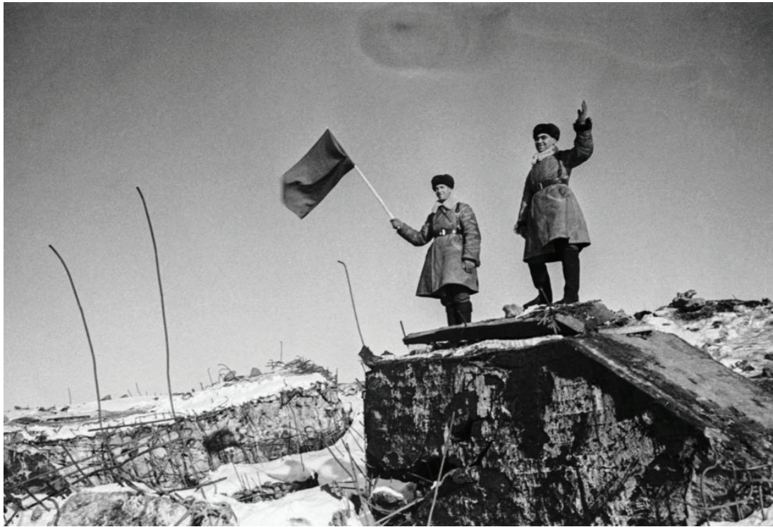
Рис. 3 [6]

некоторое моральное воздействие на противника. Мощь железнодорожных батарей № 9 и № 17, которые стреляли по Выборгу из района станции Перк-ярви вызывало у финских солдат ужас и оцепенение. Финны называли железно-