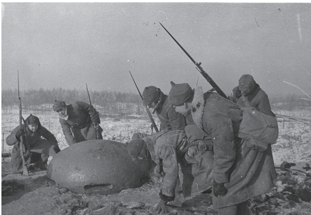
Рис. 2 [5]

бору. 12.03.1940 года в Москве был подписан Московский мирный договор.