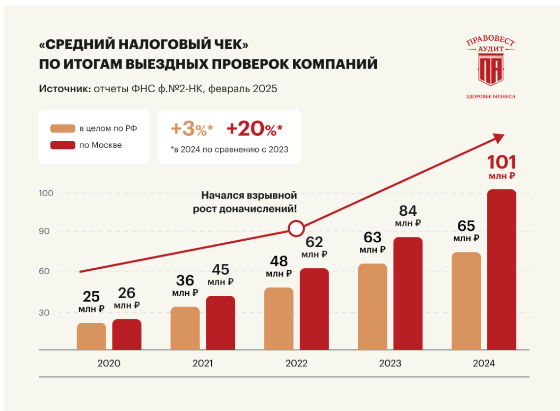
Рис. 1. Средний налоговый чек по итогам выездных проверок компаний [3]

В работе Гордеевой А. А. при изучении подходов определения достоверности финансовой отчетности были проанализированы основные классификационные признаки, к которым отнесены: сфера использования, метод регулирования, категория пользователей, предмет учета, содержание определения достоверности. Сравнение и со-