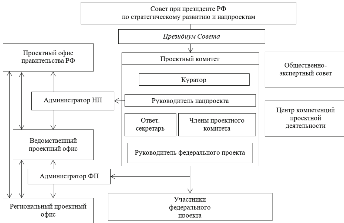
Рис. 2. Функциональная структура управления национальными проектами и федеральными проектами

ектами и проектной деятельностью. Отличительной чертой организационной структуры является наличие новых органов, таких как: