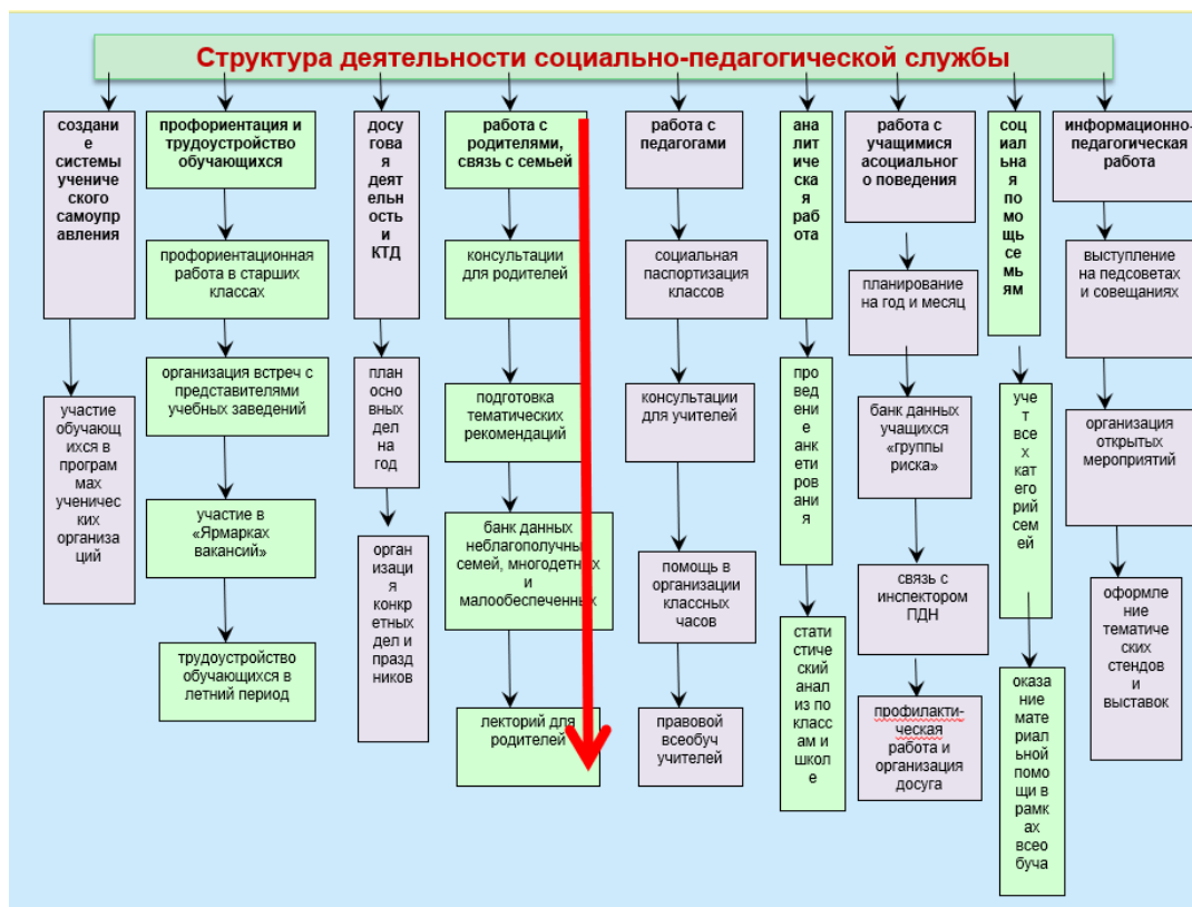
Рис. 1. Структура деятельности социально-педагогической службы

Схема социально-педагогической службы выглядит таким образом: