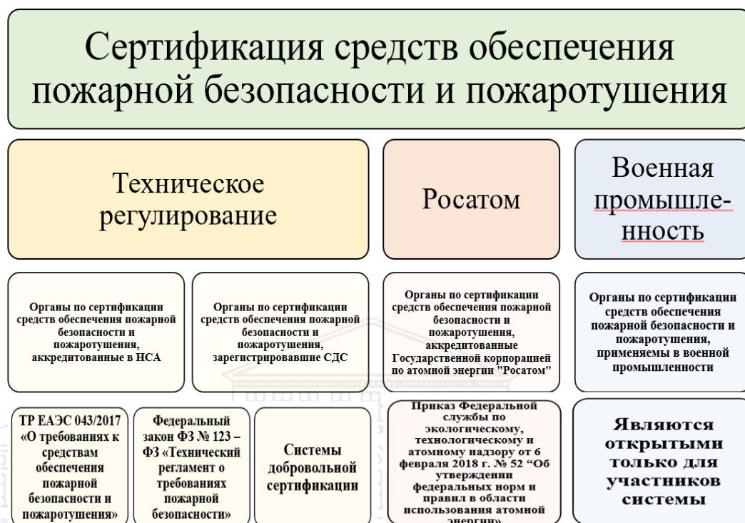
Рис. 1. Классификация требований к СОПБ

2. Следующий обязательный элемент любой схемы сертификации — исследования (испытания) и измерения продукции. В ходе него выполняется анализ и получение качественных оценок в части определения пожарно-технических характеристик и показателей пожарной опасности продукции.